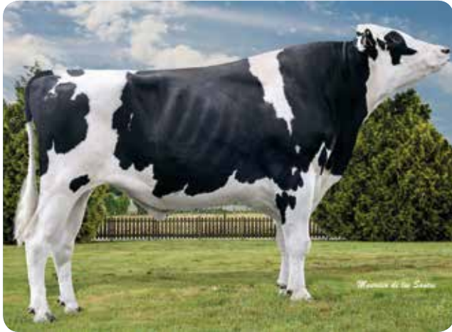
Bos Man O Man MAORI ET