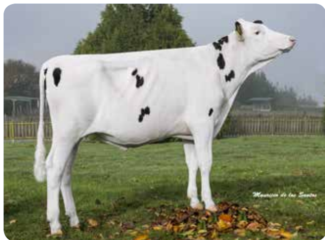
K&L PY COLINPEN